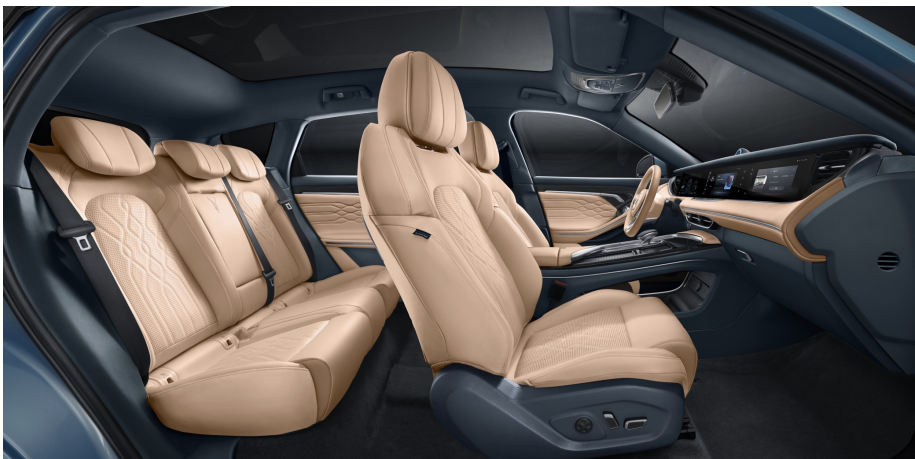
Light Brown Dark Blue