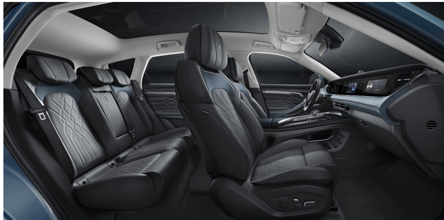
Black Dark Blue

Um das Fahrzeug noch weiter an ihre persönlichen Vorlieben anzupassen, haben Sie die Möglichkeit, aus 2 verschiedenen Innenfarben auszuwählen. Der Voyah Free bietet ergonomische Sitze, aus hochwertige Öko-Tex *Vegan-Leder mit Babycare Textilzertifizierung.